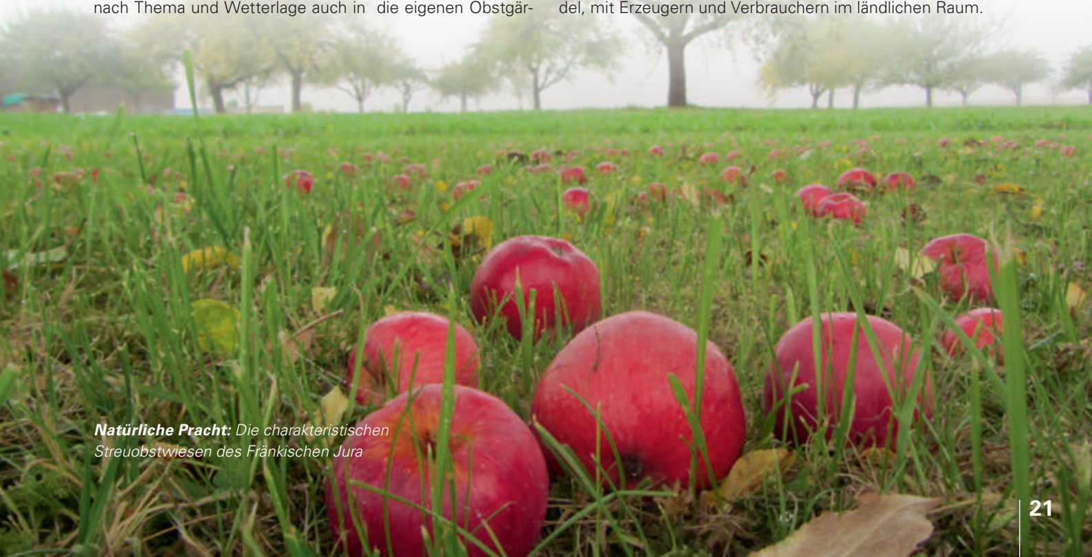
Natürliche Pracht: Die charakteristischen Streuobstwiesen des Fränkischen Jura