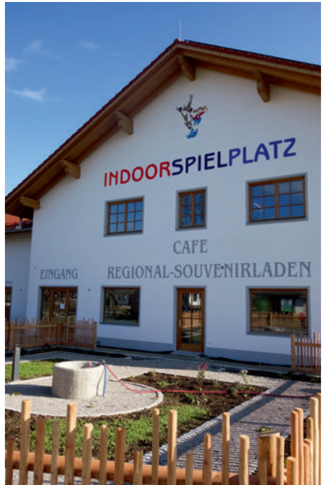
Leuchtturmprojekt: Halle, Café und Shop werden hervorragend angenommen

Lange „überfällig“ gewesen war der in den Hallen-Neubau integrierte Bahnhof für die traditionsreiche, von Groß und Klein geliebte Parkeisenbahn.