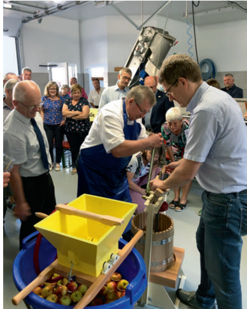
Vom Apfel zum Saft: Lernen und Genießen in der Erlebnismosterei

Heimat und Tradition sowie Natur- und Klimaschutz ohne Umwege erfahren: Die Erlebnismosterei Nennslingen in Altmühlfranken macht es möglich. Kinder und Jugendliche erleben die Herstellung von Apfelsaft, so wie er bereits von ihren Urgroßmüttern gekeltert wurde – von Hand. Sie vollziehen den Weg vom Apfel am Baum bis zum Saft nach und spüren mit allen Sinnen, wie viel Arbeit in einer Flasche Apfelsaft steckt.