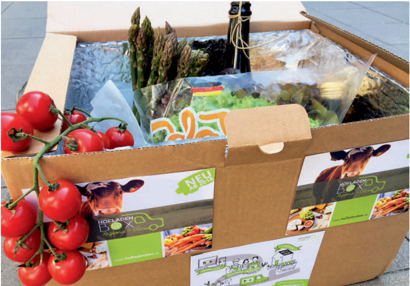
Lecker und gesund: Obst, Gemüse, Fleisch, Fisch, Molkereiprodukte und vieles mehr zeitnah aus der Kühlbox frisch ins Haus

Über das Internetportal können auch Menschen einkaufen, denen der Zugang zu regionalen Hofläden und ihren Produkten erschwert ist – zum Beispiel durch mangelnde Mobilität oder Verkehrsanbindung. Die Kunden entstammen mittlerweile auch dem urbanen Raum. Gerade Städter in der umliegenden Metropolregion Nürnberg nutzen das Angebot der HofladenBOX, um gesund und nachhaltig einzukaufen. Sie profitieren vom Angebot der CO 2 -freien Vernetzung von Stadt und Land – per Mausklick, der ihre Lebensqualität erhöht. Der Effekt: Weniger Verkehr und weniger CO 2 . Um