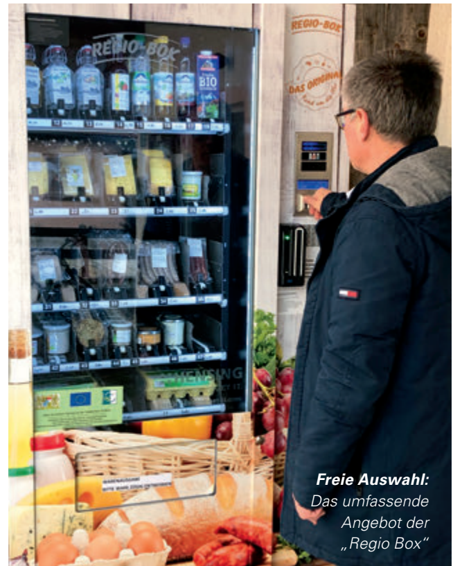
Freie Auswahl: Das umfassende Angebot der „Regio Box“

Rund um die Uhr können „auf Knopfdruck“ frische, intelligent gekühlte Produkte von den Höfen der Region erworben werden – Brot, Eier, Eiernudeln, Grillfleisch, Speck, Käse, Frischkäsevariationen und Marmeladen sowie Sirup und Schnäpse. Die Zahlung erfolgt bar oder mit sämtlichen gängigen Kreditkarten. Sogar eine sichere Altersüberprüfung für den Erwerb heimischer Weine und Brände hat der Automat eigenständig „drauf“. Fazit: Den kleinbäuerlichen Betrieben der Region bietet sich eine weitere attraktive Absatzquelle für ihre meist in Bio-Qualität hergestellten Produkte. Der „Prientaler Bergbauernladen“ und sein Waren-Automat für kundenfreundlichen 24-Stunden-Service fördert die regionale Landwirtschaft und bietet Einheimischen sowie Gästen hohe Qualität und kurze Wege.