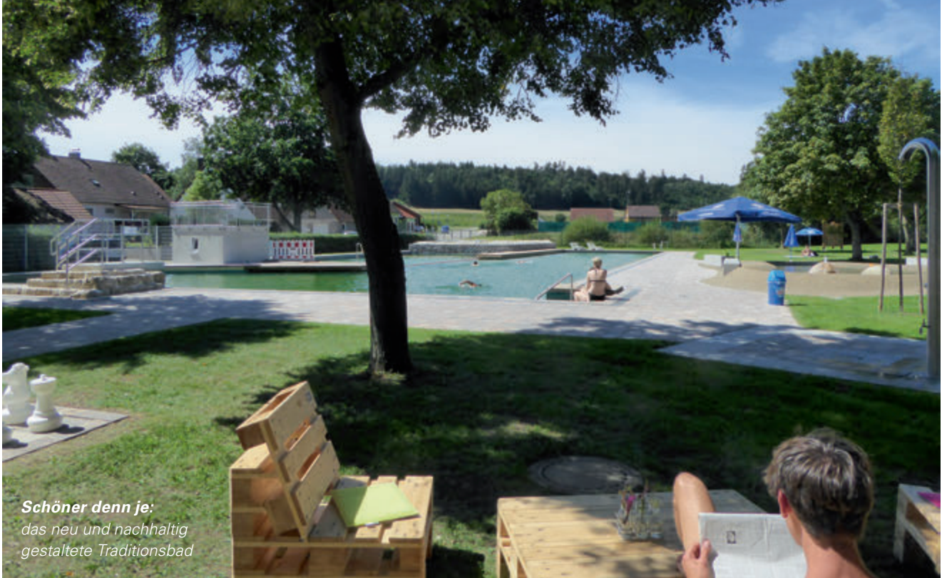
Schöner denn je: das neu und nachhaltig gestaltete Traditionsbad

mehr einladend – an eine touristische Nutzung für die Feriengäste der Region war nicht zu denken. Schließlich beantragte die Marktgemeinde Dombühl LEADER-Mittel und legte sich finanziell gestärkt umso mehr für ihr „Naturerlebnisbad“ ins Zeug.