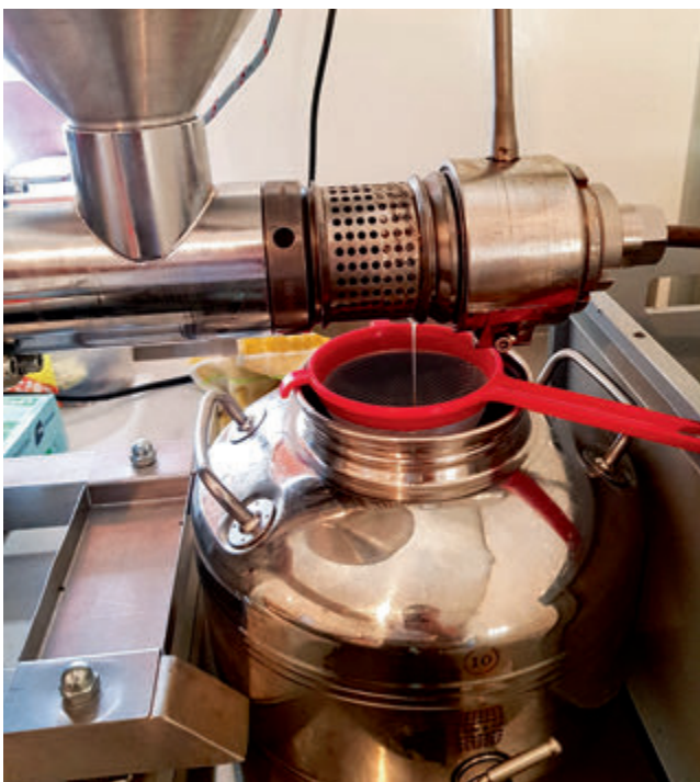
Traditionelles Verfahren, modernste Technik: Eine leistungsfähige neue Ölmühle