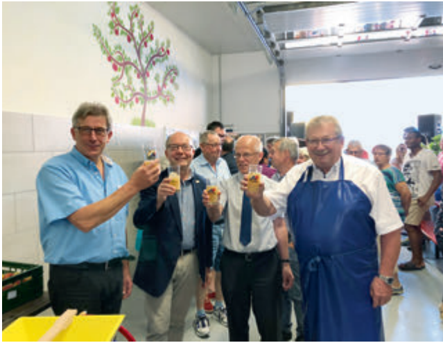
Auf unsere Gesundheit!: Einweihung der Erlebnismosterei vor großem Publikum

Rund 150 Mitglieder des Obst- und Gartenbauvereins Nennslingen sind im Projekt engagiert. Vor allem ihrem Bewusstsein für und ihrer Liebe zur Tradition der Obstverwertung im Fränkischen Jura ist es zu verdanken, dass die Erlebnismosterei aus der Taufe gehoben wurde. Das von ihnen initiierte LEADER-Projekt erhält die Kulturlandschaft des Fränkischen Jura mit seinen landschaftsprägenden Streuobstwiesen. Während der Mostsaison werden zudem saisonale Arbeitsplätze zu fairen Bedingungen vor Ort geschaffen. Die Wertschöpfungskette von der Pflege der Streuobstbestände bis zum Genuss des Saftes schärft das Bewusstsein für gesunde und nachhaltige Ernährung.