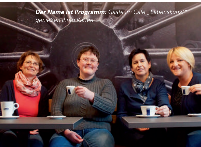
Der Name ist Programm: Gäste im Café „Lebenskunst“ genießen ihren Kaffee

Ergänzend bewährt sich der Musikbahnhof als Kommunikationsort für jugendliche Musiker der Region. Die Räume bieten Platz, professionelles Equipment und ideale Bedingungen für Bandproben. Mit der „Kulturbühne Gleis 1“ in der einstigen Gepäckaufbewahrung steht ein kleiner Veranstal-